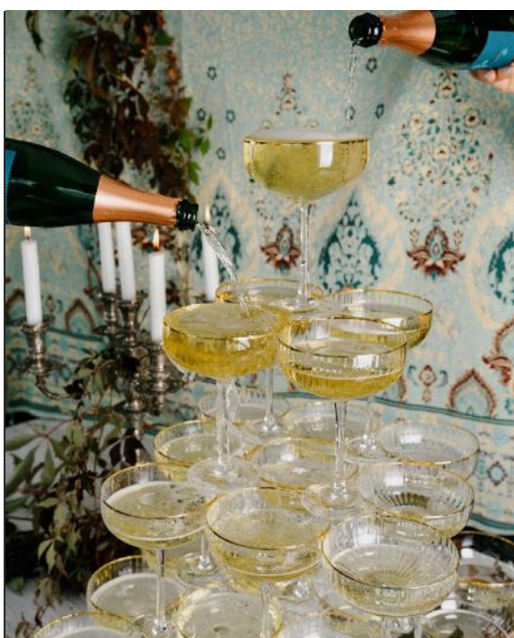
G E N U S S