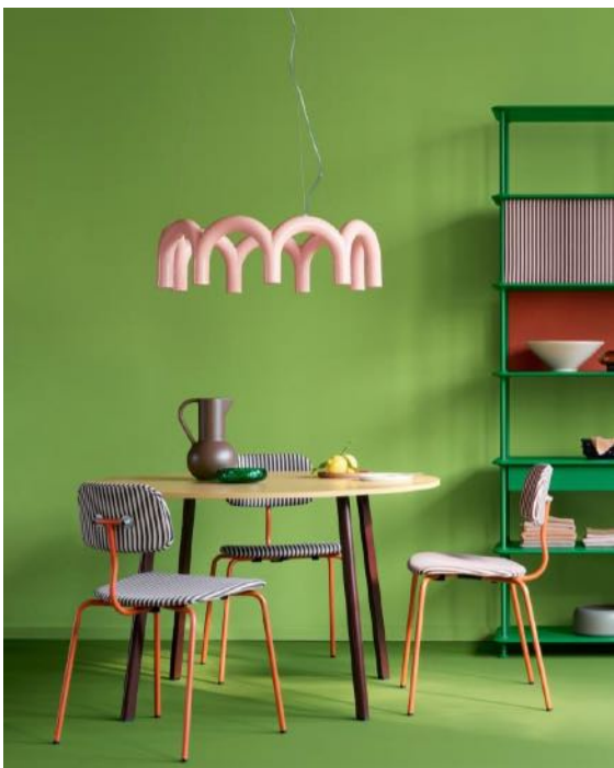
W O H N E N