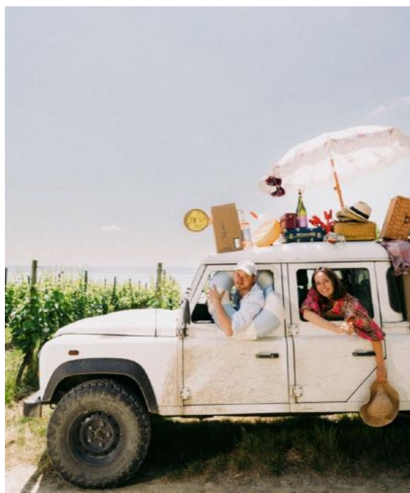
R E I S E