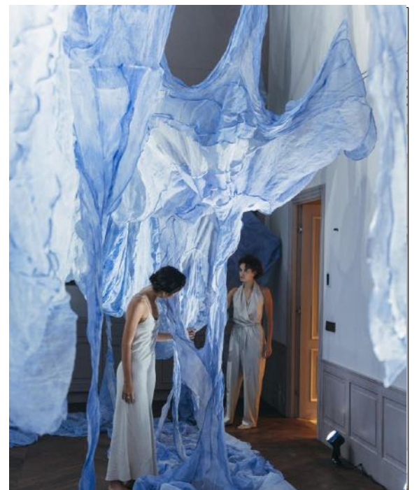
K U N S T & K U L T U R