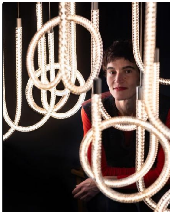
D E S I G N